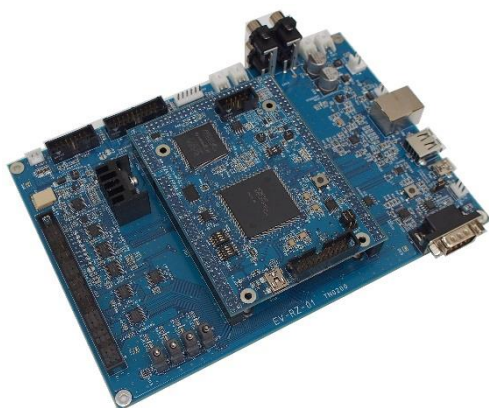
写真は EV-RZ-01 と MP-RZA1H/FPGA-01 です 各セット価格はホームページをご覧ください